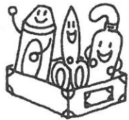
クレヨン、ハサミ、のり