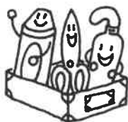
クレヨン、ハサミ、のり